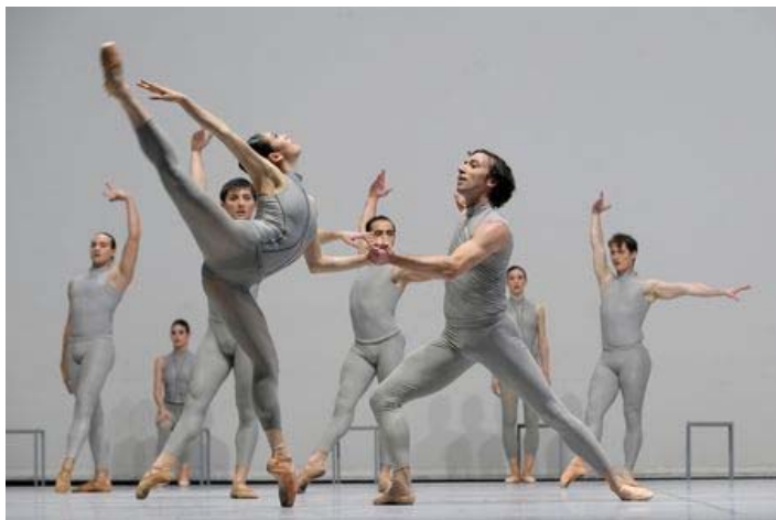
Körper.Tanzen.Formen - The Second Detail