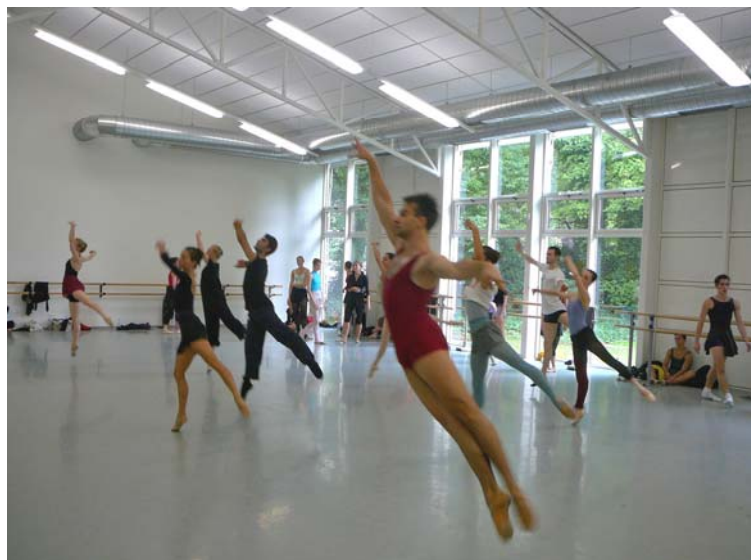
Sommerakademie im Ballettzentrum Westfalen

Bleiben wir beim Bild der Funkzentrale: Funk basiert auf einem einfachen Prinzip – es gibt einen Sender und einen Empfänger. Ohne Empfänger ist der Sender zwecklos. Aber der Funkverkehr hängt noch von anderen Faktoren ab, dem Klima, der Beschaffenheit der Funkwellen etc. Es bedarf der Verstärker und Transmitter, um eine Botschaft von A nach B zu bringen. Für uns sind die Ballettfreunde unverzichtbare Meinungsmultiplikatoren. Ihre Ansichten, ihre Energie, ihr unermüdliches Engagement stärken uns den Rücken, und wenn einmal der politische Wind wieder ganz scharf weht, wissen wir, auf wen wir uns verlassen können – die Ballettfreunde. Freunde sind wichtig im Leben, ohne sie verliert man irgendwann einmal den Mut.