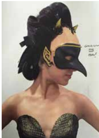
Wolfgang Maßberg