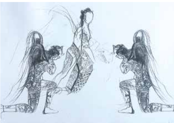
Teufel und Dämonen: Figurinen von Bernd Skodzig...

An die Kostüme von Tänzern werden ganz besondere Anforderungen gestellt, erläutert Bernd Skodzig. Sie müssen die Rolle unterstreichen, die die einzelnen Akteure darzustellen haben. Die verwendeten Stoffe müssen nicht nur gut aussehen, sondern zugleich belastbar und bequem sein und dürfen die tänzerische Entfaltung keinesfalls einschränken. Ein erfolgreicher Kostümbildner muss daher nicht nur die optische Wirkung von Stoffen sondern auch deren Eigenschaften gut einschätzen können. Schließlich müssen sie auch mit dem Bühnenbild und der Beleuchtung harmonieren.