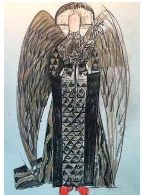
Bernd Skodzig: Figurine eines Engels (Faust I)

Bernd Skodzig entwirft für internationale Theater und Opernhäuser großformatige Kostümausstattungen. Er studierte an der Staatlichen Akademie der Bildenden Künste in Stuttgart und ist Schüler des Bühnenbildners Jürgen Rose. 1993 ging er nach London, um als freier Mitarbeiter in der Textiliensammlung des Victoria and Albert Museums zu arbeiten. Historische Kostüme des 16. bis 18. Jahrhunderts bildeten den Schwerpunkt seiner Arbeit. Seine eigentliche Karriere begann im Jahr 2000 an der Berliner Schaubühne, als er Kostüme für zeitgenössische Stücke und moderne Choreografien entwarf. Berühmt ist aus jener Zeit sein Kostümbild für die Schaubühnenproduktion „Körper“ der Choreographin und Regisseurin Sasha Waltz. Nach diesem Durchbruch taucht sein Name als Kostümausstatter an den berühmtesten Theatern in ganz Europa auf, u.a. im Zusammenhang mit der Jubiläumsaufführung von Strawinskys „Le sacre du printemps“ anlässlich der Eröffnung des neuen Mariinsky Theaters 2013 in St. Petersburg.