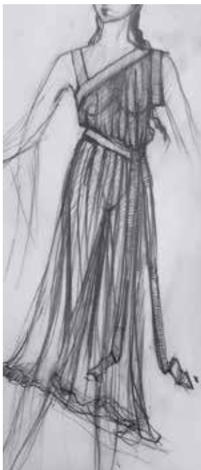
Entwurf für Helena in Faust II