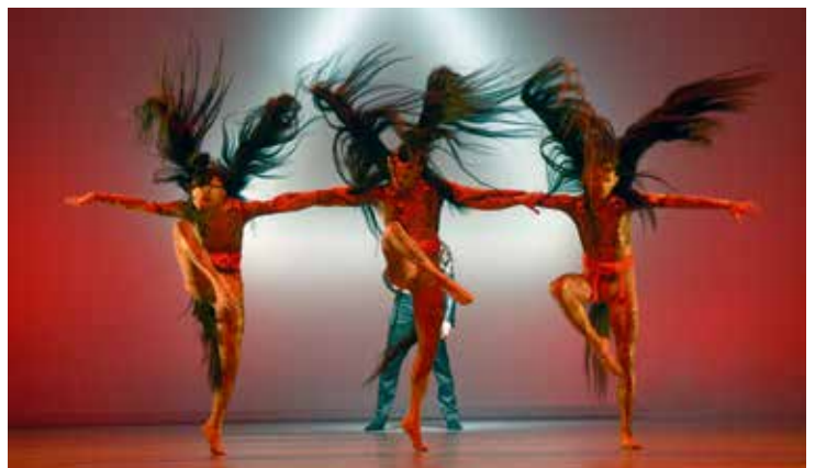
... und auf der Bühne (Corps de Ballet in Faust I)

Anhand von Skizzen, Fotos, Collagen und Stoffmustern entstehen die Entwürfe in Form von Figurinen, die häufig für sich bereits Kunstwerke sind. Die Umsetzung der Entwürfe bedingt eine stete Abstimmung mit der Ballettleitung und der Kostümabteilung des Theaters bezüglich der technischen, zeitlichen und nicht zuletzt der finanziellen Machbarkeit. Besonders hoch sind bei der Kostümausstattung von Balletttänzerinnen und -tänzern die Qualitätsanforderungen an die zu verwendenden Stoffe sowie die ausgesprochen hohen handwerklichen Anforderungen für deren Bearbeitung und ornamentale Veredelungen in Form von Handdrucken, Stickereien und Applikationen.